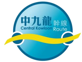
附圖一 Attached Map 1

第一階段臨時交通改道措施預計於 2018 年 9 月中至 2018 年 10 月初實施。 Stage 1 TTA scheme will be implemented from mid September 2018 to early October 2018 tentatively.