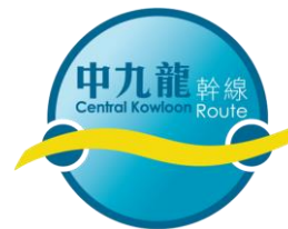
附圖二 Attached Map 2

第二階段臨時交通改道措施預計於 2018 年 10 月初至 2020 年第一季實施。 Stage 2 TTA scheme will be implemented from early October 2018 to 1 st quarter of 2020 tentatively.